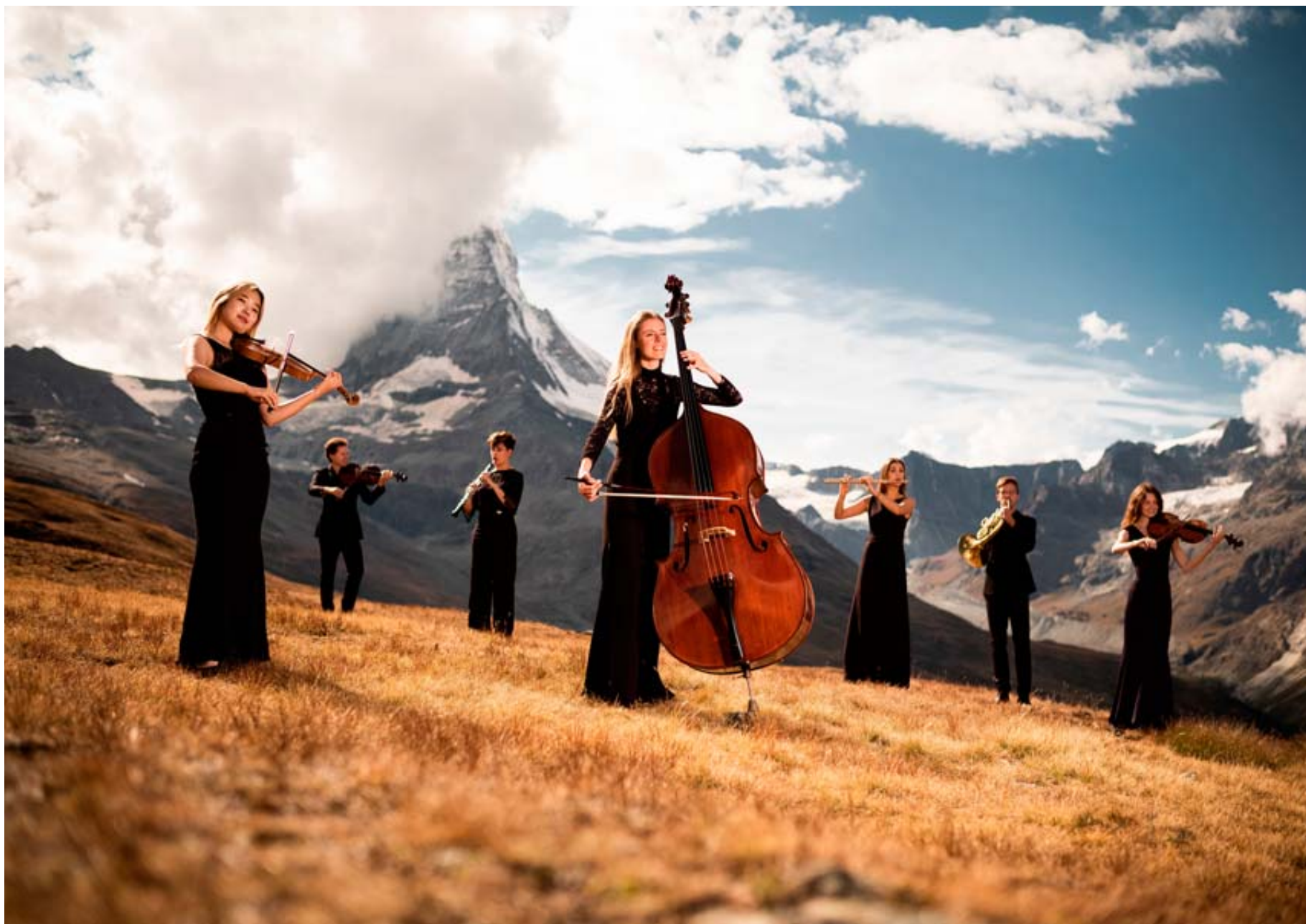
À l'image du Zermatt Music Festival & Academy, les festivals classiques valaisans vont de plus en plus hors les murs, proposant des concerts en nature ou dans des lieux inédits.