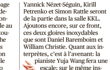
Yannick Nézet-Séguin, Kirill Petrenko et Simon Rattle seront de la partie dans la salle KKL.

En atteignant la dernière page de son programme, on se demande qui des artistes incontournables ne fait pas escale au Lucerne Festival. Comme toujours, la manifestation coiffe toutes les cases et aligne les stars. Du côté de la direction d'orchestre, il y a bien sûr le maître de maison, Riccardo Chailly, qui ouvre le bal - il sera là pour la suite aussi - face à une formation qui agrège les solistes dans ses rangs et qui a des allures de dream team . Les étoiles montantes Mirga Grazinyte-Tyla et Lahav Shani, tout comme Daniel Harding,