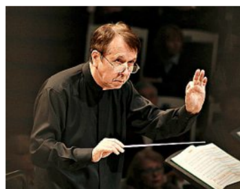
Le pianiste et chef russe Mikhaïl Pletnev.