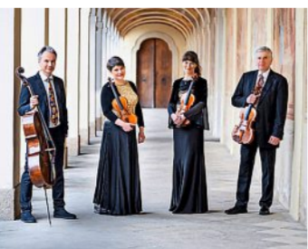
Le Quatuor Pražák est de retour à Champéry.