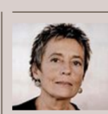
Maria João Pires Pianiste portugaise

Piano En 2017, elle avait annoncé prendre sa retraite, mais Maria João Pires a repris le chemin des salles de concert pour le plus grand plaisir de ses admirateurs. «J'avais le besoin de m'arrêter, et je pensais me retirer complètement à ce moment-là, confiait-elle récemment sur Radio Classique. Quelques années plus tard, j'ai eu le besoin de jouer de nouveau devant un public. Quand notre senti et nos besoins changent, il faut s'écouter.» La pianiste née en 1944 à Lisbonne est plus que jamais une légende vivante de la musique classique, par son refus de la virtuosité tapageuse et du star-system, par la douceur de son jeu, particulièrement adapté aux confidences