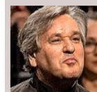
Antonio Pappano Chef d'orchestre

Lors de sa première apparition à Verbier, au début des années 1990, Antonio Pappano n'était qu'une belle promesse. Son talent, il le laissait entrevoir à la Monnaie de Bruxelles, où il venait d'être nommé directeur musical. Une éternité plus tard, le chef britannique d'origine italienne est de retour dans la station avec un statut qui n'a cessé de grandir depuis. À la tête du Royal Opera House de Londres et de l'Académie nationale