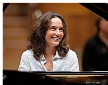
Hélène Grimaud joue Mozart le 16 août.